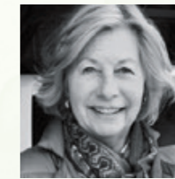
Ausgewählt von Marlene Ippen