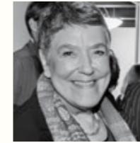
Gelesen von Sabine Dultz